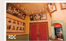
Un cinéma de style ancien, aux allures de l'ère Showa.