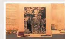
Découvrez ici exposés manuscrits originaux et biens de l'auteur du livre "Vingt-quatre Prunelles", Sakae Tsuboi.