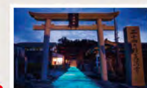
Le Temple Tenmangu abrite un esprit divin transféré du temple Dazaifu Tenmangu. Prédisez votre avenir à l'aide d'une phrase de Shakespeare.