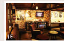
Au 1er étage, le paisible Café Livre. Admirez-y la superbe vue depuis la fenêtre!